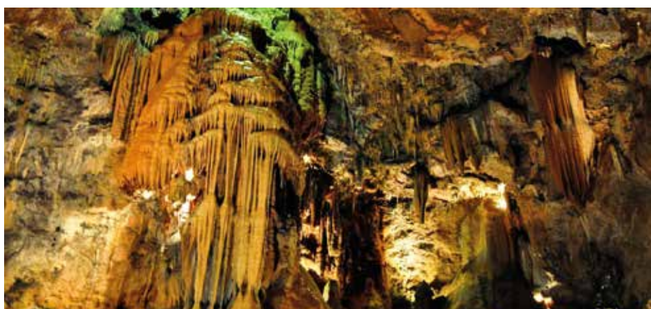
CUEVA DE VALPORQUERO