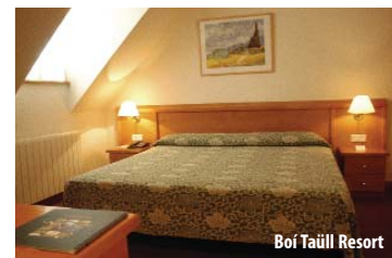
Boí Taüll Resort