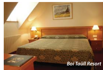
Boí Taüll Resort