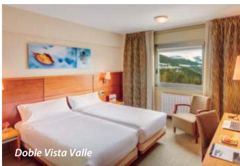
Doble Vista Valle