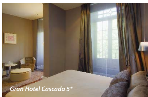
Gran Hotel Cascada 5*