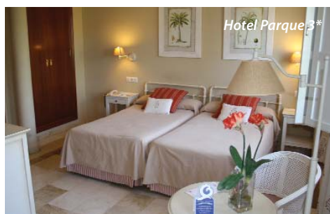
Hotel Parque 3**