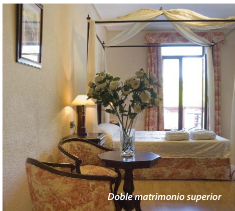
Doble matrimonio superior

Ampliando su estancia con un 2º programa por persona, se reducirá un 10% el precio del programa de inferior coste. Nota: No aplicable en saludable 1 noche.